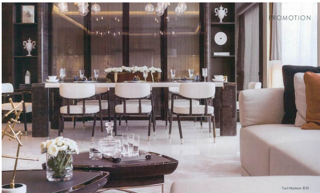
Turri Madison 系列